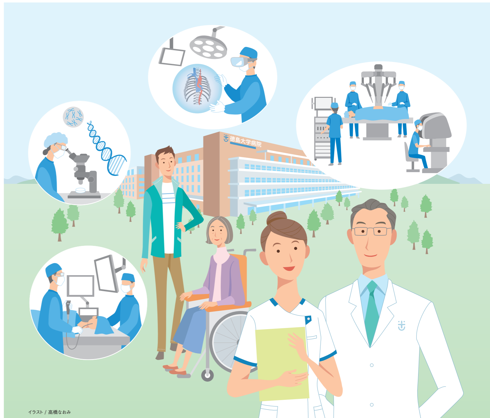
イラスト / 高橋なおり